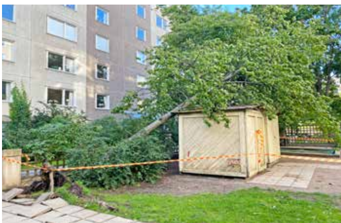
Den stora stormen i höstas fällde bland annat ett träd på CD-gården. Som tur verkar ingen ha kommit till skada och trädet togs snabbt bort därifrån.