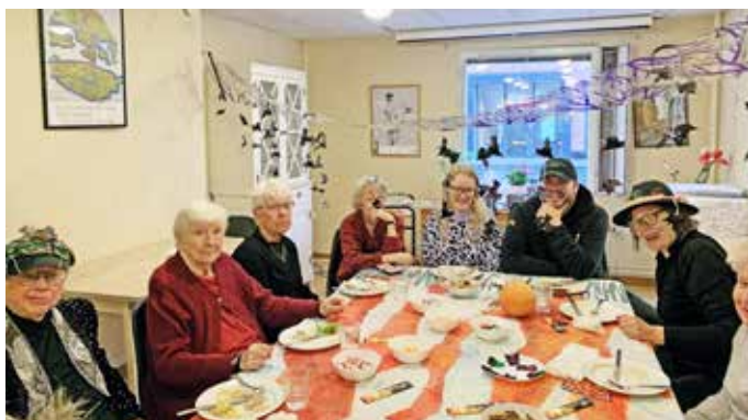
Även i år firade vardagslediga Halloween.