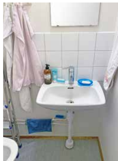
Ett orenoverat wc med kakelplattor