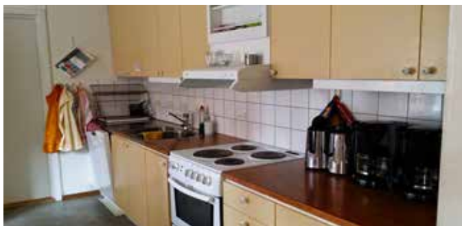
I köket finns bra utrustning för matlagning.

Inför nästa år behöver vi bli fler som hjälper till med vardagslediga på torsdagar. Är du intresserad så hör av dig till: Topsy Bondeson: 070 627 48 79.