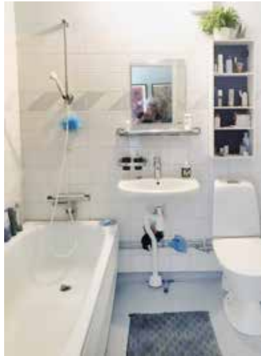
Dagens orenoverade standardbadrum

Grovkök och toaletter får ommålning med vit färg vilket är underhåll. Några vita kakelplattor tillkommer i vissa lägenheter mellan tvättställ och spegel på toaletterna, vilket möjligen är en standardhöjning.