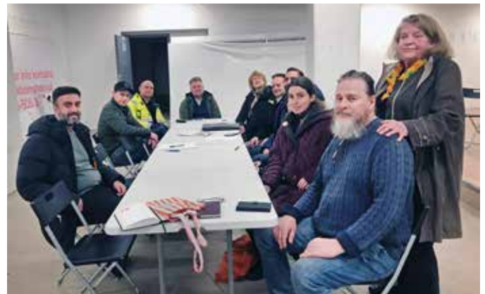
Projektledarna till vänster och stambytesgruppen till höger.

Både stambytesgruppen och projektledarna verkade vara nöjda och glada när mötet slutade.