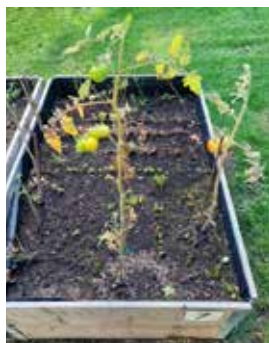
Här frodas det inte.

De stackars odlingslådorna på E-gården gjorde däremot ingen glad. Trots vattning, vård och ansträngning av flera odlare så blev resultatet väldigt magert. Se bild till vänster. Dags för bättre jord från Stockholmshem.