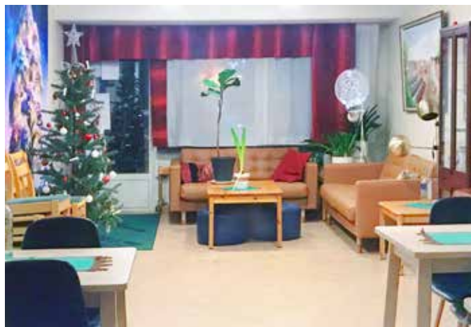
Lokalen har fått nya soffor i år.