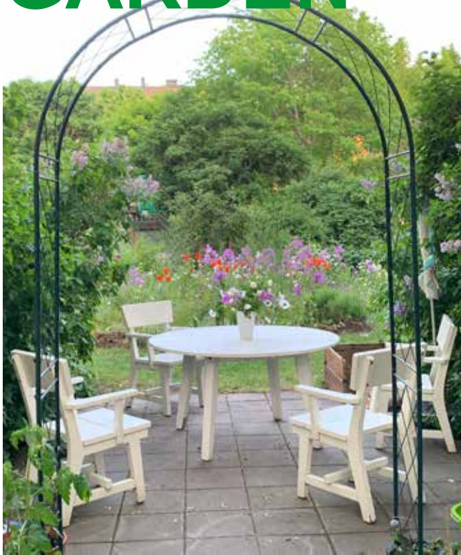
Midsommarprakt på AB-gården.