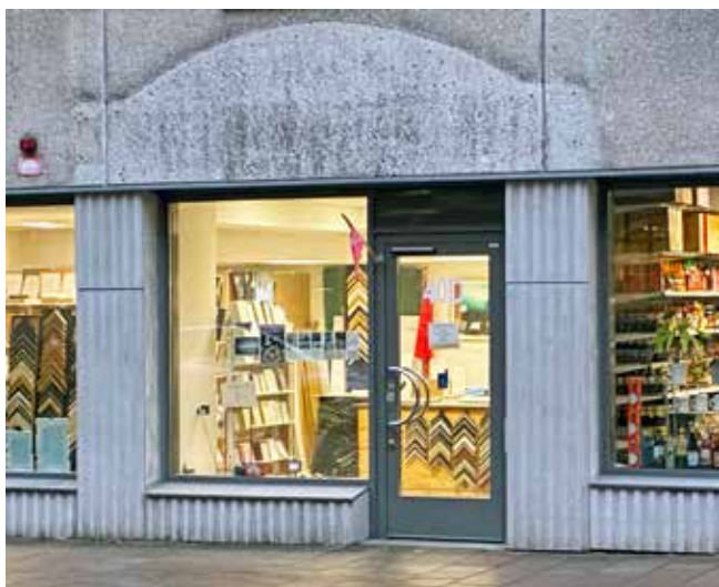
Man ser på fasaden att ingången till hotellet låg här.

I denna berättelse vill jag lyfta fram vilka verksamheter som fanns i området vid Millennieskiftet och vilka som är aktuella idag år 2025.