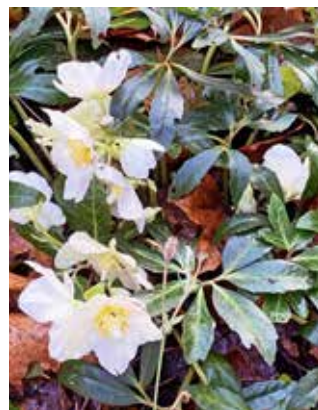
Julrosor på CD-gården.